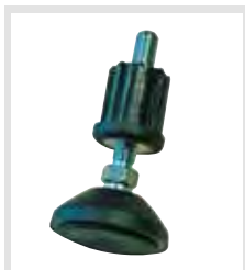
Az állítható magasságú talplemez biztonsági tartozékként rendelhető